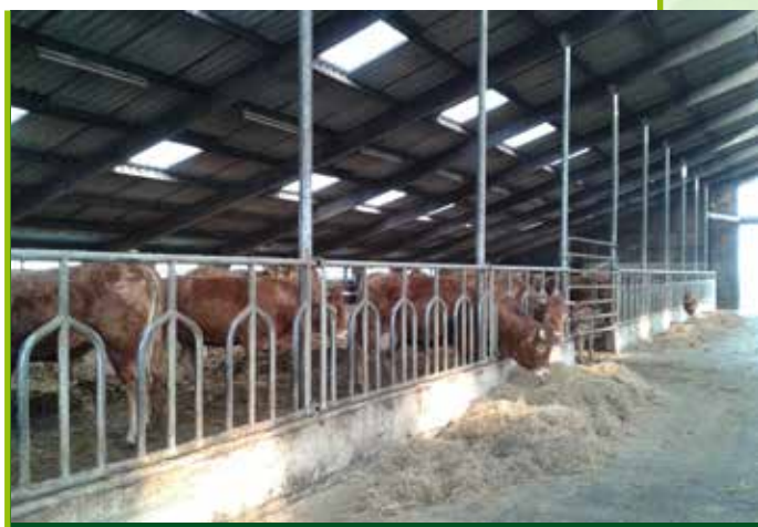
In de potstal