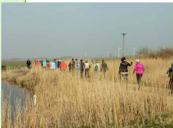
Wandeling door de Súdermarpolder

De wandeling eindigde bij de boerderij die met name door De Vries zijn echtgenote Roelie wordt gerund. De koeien verblijven in een zgn. potstal, een traditionele leefwijze waarbij de mest wordt opgepot en op gezette