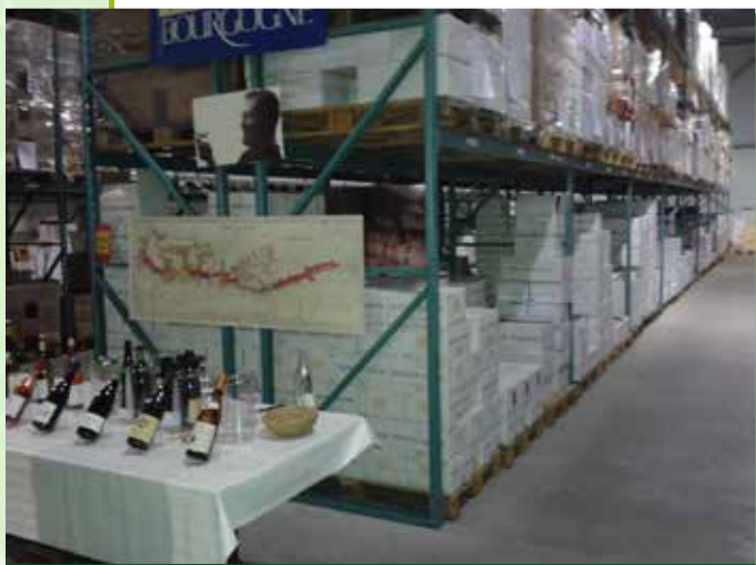
Wijnproeverij bij De Vier Heemskinderen

spugen in royaal uitgevoerde kwispedours. Uw correspondent stelde wel vast dat deze discipline ietwat minder werd naarmate de proeverij vorderde! Dit werd ook veroorzaakt door het feit dat er allerhande heerlijkheden werden opgediend, verschillende soorten