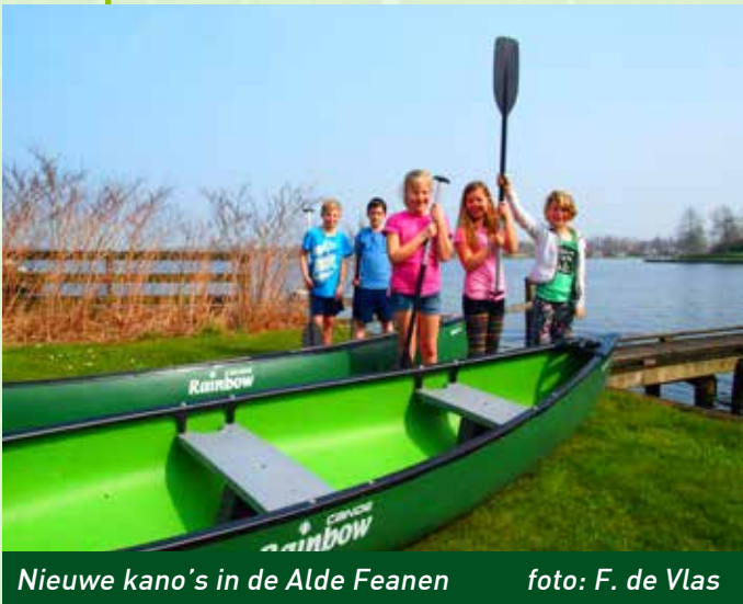
Nieuwe kano's in de Alde Feanen

De Stichting Ynnatura biedt bedrijven en organisaties de mogelijkheid zich te verbinden met het werk van de natuurbescherming in Fryslân door concrete en herkenbare projecten van It Fryske Gea te ondersteunen.