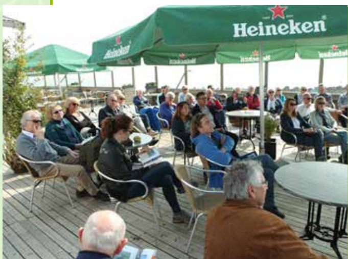
Welkom bij strandrestaurant De Potvis

Op vrijdag 10 april jl., de eerste warme lentedag van dit jaar, was de opkomst van maar liefst 44 personen aan de voorjaarsexcursie van Ynnatura wellicht illustratief voor de met zorg uitgekozen programmaonderdelen: een prachtige natuurbeleving en de geneugten van heerlijke Franse wijnen.