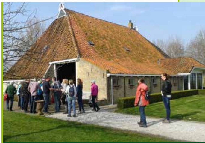
Bij de boerderij van familie De Vries

Samen met broer Jan importeren zij bijzondere wijnen uit Frankrijk, die vervolgens aan gerenommeerde restaurants en verschillende wijnhandelaren worden geleverd. Overweldigd door de grote hal waarbinnendeverschillende kwaliteitswijnen op een constante temperatuur van 13 graden op voorraad worden gehouden, is het een lust om de beide broers de geneugten van wijn te horen uitleggen. Originele en onvergelykbare aroma's, smaken die een verschillende beleving geven. Echter altijd onmiskenbaar eenzelfde kenmerk: kwaliteit. Bijzonder was om te horen welk een energie moet worden gestopt in het jaarlijks bezoeken van de verschillende domaines in Frankrijk om daar met de lokale wijnboeren te spreken over de